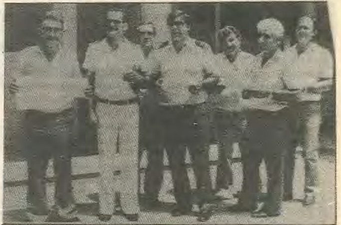
Οι υπάλληλοι της Αρχής Λιμένων με το διάταγμα της επιστράτευσης.

Οι εργοδοτικές οργανώσεις - ΚΕΒΕ ΟΕΒ - μπροστα στην αντίδραση